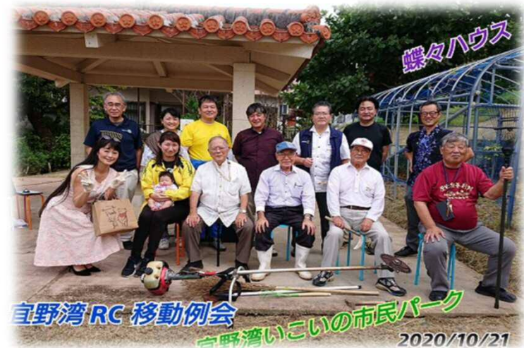
宜野湾RC 移動例会 宜野湾いこいの市民パーク 2020/10/21 第2面: RID2580、宜野湾ロータリークラブ