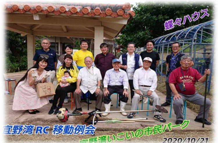
第2面: RID2580、宜野湾ロータリークラブ