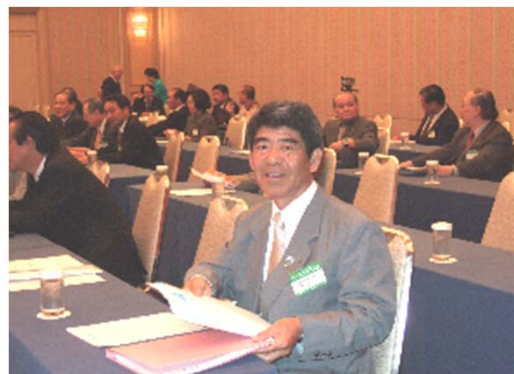
パワーポイント風景