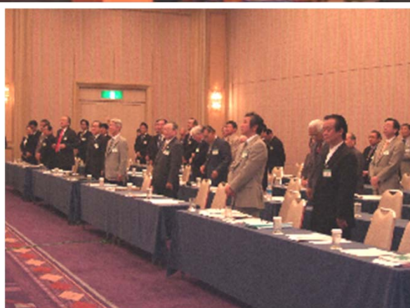
フロア（参加クラブ指導者の皆様）