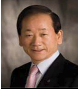
2008-09年度 国際ロータリー会長 李 東建