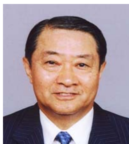
国際ロータリー第2580地区 ガバナー 浅川 皓司

本日ここに国際ロータリー第2580地区2007～08年度沖縄分区のPETSならびに地区協議会が、多数のロータリアンのご参加を得て開催される事になりました。