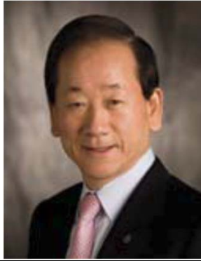
2008-09年度 国際ロータリー会長 李 東建