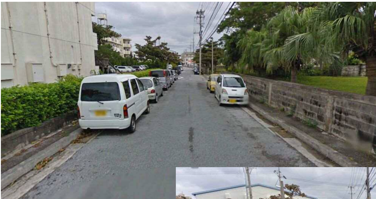
伊利原市宮住宅側の道路状況