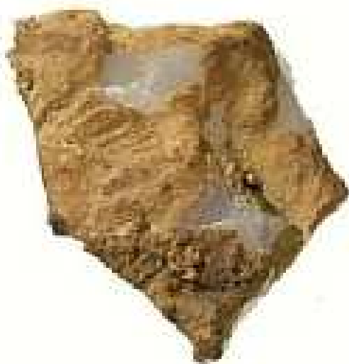
見つかった石 英製の石器