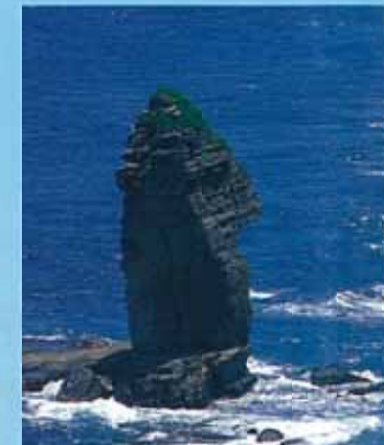
立神岩 (與那國島) 聳立在怒海瀟瀟間的奇岩，是與那國島的指標。被稱為神岩，深受島民敬畏。從立神岩展望台能一覽無遺。