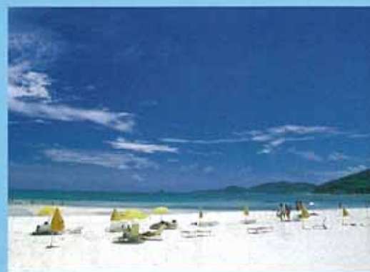
IFU海濱(久米島) 被選為日本百選之灘的美麗海灘。純白的沙灘長及2公里，因為是平淺灘的關係，即使帶小朋友過來也能安心嬉戲。附近住宿設施和餐飲店充實齊全。