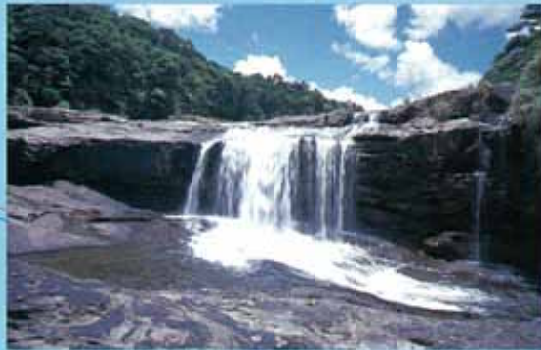
MARYUDU之瀧 (MARYUDU瀑布) (西表島) 位於浦內川的大瀑布。雖然水的高差不大，但卻有兩層瀑布重疊是其特徵。可以坐遊覽船到軍艦岩，漫步約30分鐘後可以抵達。上流還有KANPIRE瀑布。