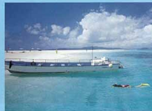
終端之濱(Hate之濱)(久米島) 浮在久米島海面7公里之遠的無人島。藍藍色的海和白沙灘絢麗奪目，距離久米島坐船只要10分鐘的便捷度也是它大受歡迎的理由。