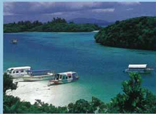
川平灣 (石垣島) 據說海水顏色1天改變7次的美麗海灣，被指定為日本國家風景區。雖然此處禁止游泳，但可以乘坐玻璃船欣賞珊瑚礁的美景。這裡也以黑珍珠的養殖場聞名。