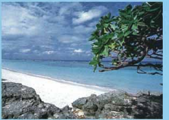
NISHI濱 (波照間島) 波照間島是日本最南端的有人島。彷彿塗了無數層次、層次分明的海水顏色，奪人心目。夜晚還可眺望有南十字星的滿天星斗。