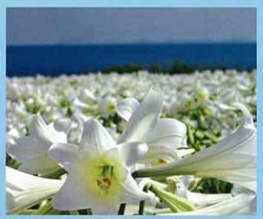
鐵砲百合 (伊江島) 伊江島以美麗的花海聞名，位在其北每岸的LILY FIELD公園，每年4月下旬會舉辦伊江島百合祭。20萬株、100萬朵的鐵砲百合爭相綻放，吸引眾多旅客造訪。