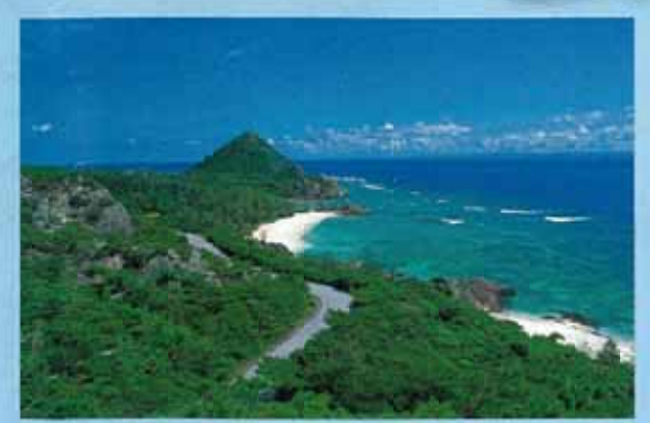
伊是名城跡 (伊是名島) 伊是名島是琉球王朝第二尚氏的始祖尚圖王的出身地，位於島嶼東南端的伊是名城跡，三方都是面海的絕壁，宛如金字塔的造型為其特色，山麓下有名為玉御殿的帝王陵寢。