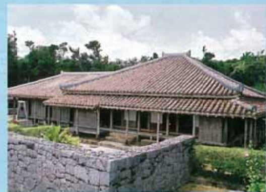
上江洲家(久米島) 1750年左右建造，士族所居、歷史悠久的紅瓦建築。還保有屏風(驅魔避邪的屏障)、養豬小屋等古代民家風景，別有一番風情。入場券300日幣。