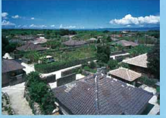
竹富島 (竹富島) 昔日的紅瓦街景還原封不動地保留下來。乘坐著水牛車，傾聽耳畔三線琴的音色，沖繩的原始風景就此復甦。最適合騎自行車環島。