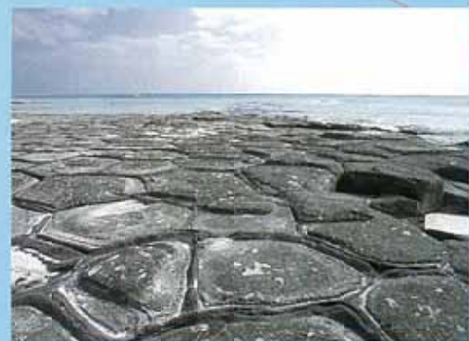
壘石(久米島) 遍布在奧武島西南部，獨特的六角狀岩群。由於形狀宛如龜甲，因此被稱為龜甲石，是沖繩縣指定的天然國寶。