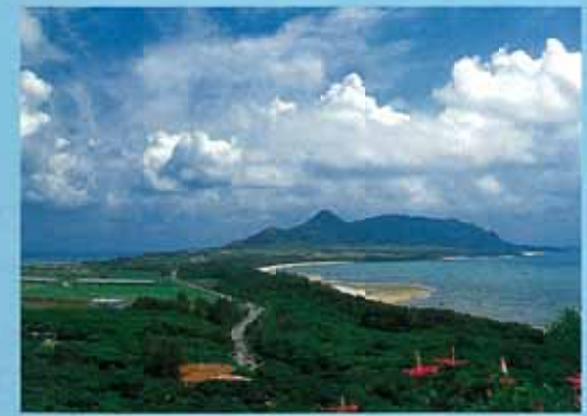
五取崎展望台 (石垣島) 位於金武岳東邊山麓的展望台。可將遠至石垣島最北端的平久保崎海角盡收眼底，融合山海的美景令人讚嘆。四周種滿扶桑花，也可享受散步之趣。