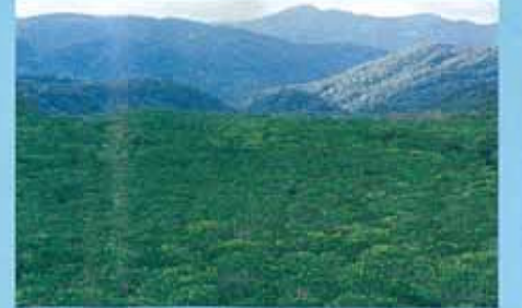
西表島的自然風光 島上90%原始叢林遍布。有先島銀葉樹——其特徵為巨大發達的板根，和國寶動物西表山貓等稀有的動植物棲息。