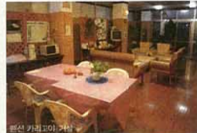
펜션 카리고야 거실

※ ACCESS 항구에서 도보 약 12분 / 승영은 상담 후 결정 ※ 전화 0980-50-6580 ※ 체크인/아웃 14:00/10:00 ※ 시설 샤워실, 화장실, 세면장 공동 이용 / 에어컨 물비누, 샴푸, 전드레인지, 냉장고, 청소 제공 ※ 룸 타입 트윈 4개, 패밀리 2중 침대 1개+더블침대 1개 1개 ※ 개인 준비물 칫솔, 치약, 타월 ※ 1인당 요금 숙박 ONLY 2,500엔 ※ 추천템 가죽(친구)커튼