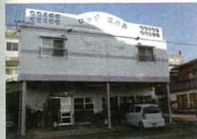
펜션 카리고야 펜ション KARIGOYA

※ ACCESS 항구에서 도보 약 10분 / 미리 예약하면 무료 승영 가능 ※ 전화 0930-50-6110 ※ 체크인/아웃 14:00/10:00 ※ 시설 각 객실에 세면도구, 에어컨 구비 ※ 룸 타입 화장실 2개, 양실 4개 ※ 개인 준비물 타월 ※ 1인당 요금 숙박 ONLY 5,000엔 / 조식 포함 5,500엔 ※ 추천템 친구(커피)가죽