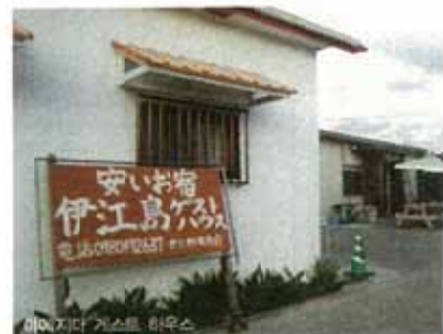
이에지마 게스트 하우스

※ ACCESS 항구에서 도보 10분 / 승영은 상담 후 결정 ※ 전화 0980-49-2837 ※ 체크인/아웃 13:00/12:00 ※ 시설 에어컨 TV, 주방, 냉장고, 세탁기 인터넷, 샤워실, 샴푸, 화장실 무료 ※ 룸 타입 2인상 1개, 디디방 5개, 더블 침대 4개 ※ 개인 준비물 칫솔, 치약, 타월 ※ 1인당 요금 2인상 1,500엔(에어컨 없음), 2인상 별관 양실 2,500엔, 3인상 디디방 2,000엔 ※ 홈페이지 http://eges.boc.jp ※ 추천템 친구(커피)