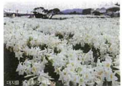
대지엔 20여 채의 민가