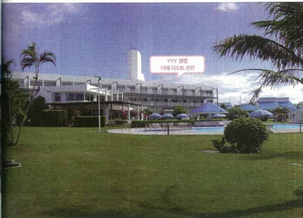
YYY 클럽 이에 리조트 본관