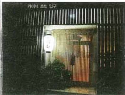
카에데 초밥 입구

미나토 초밥보다 좀 더 고급스러운 분위기다. 주인아저씨는 서글서글한 기분과, 별도의 메뉴판은 없고 예산에 맞춰 초밥을 내준다. 스시(초밥) "나미(중급) 또는 "포우(상급)"로 말하면 되고 카운터석에 앉으면 원하