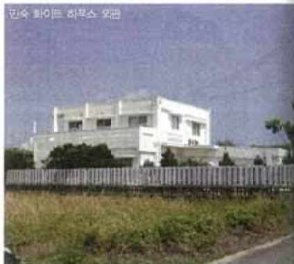
민숙 화이트 하우스의 정갈한 식사