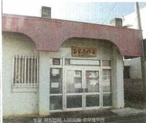
벌꿀 제조업체 나미지트 오우호우엔

※ 특전 JUST GO 쿠폰을 제시하면 직접 양봉을 하는 벌꿀 제조업체 '나미지트 오우호우엔(並里養蜂園)'의 벌꿀을 도매가격에서 10% 할인 해준다. ※ 홈페이지 http://www.honey-bee.tv ※ 전화 0990-49-5534 ※ ACCESS 항에서 차로 3분, 도보 15분 / 낮에는 일을 하므로 저녁 5시~밤 9시까지만 영업하며 화, 금요일은 밤 10시까지 영업 ※ 정기휴일 일요일(일요일 외에도 사정에 따라 쉬 수 있음) ※ 도매가격 이에섬 꿀(ハチマチみつ・アイゼマハチミツ) 150g은 500엔, 300g은 1,000엔, 생로열제리가 들어간 꿀(生ローヤルゼリー入り)는 500g은 2,000엔, 나미호~아루제리 이리 하치미츠 300g은 2,000엔