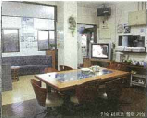
민숙 마르크 플로 거실

※ ACCESS 항구에서 도보 3분 / 승영 안 됨 ※ 전용 욕실 4개 6242 ※ 체크인/아웃 14:00/10:00 ※ 시설 샤워실, 화장실, 세면장 공동 이용 / 에어컨 TV 완비 ※ 룸 타입 화장실 3개, 트윈상대 사이즈 침대 2개 4개, 더블링 사이즈 침대 1개 1개 ※ 개인 준비물 칫솔, 치약, 타월 ※ 1인당 요금 숙박 ONLY 4000엔 / 조식 포함 4,500엔 ※ 추천템 친구(커피)가죽