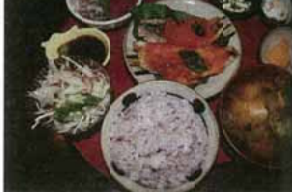
민숙 화이트 하우스 民宿ホワイトハウス