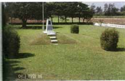
어니 파일 비

어니 파일(Ernie Pyle·1900~1945)은 1944년 풀리처상을 수상한 미국의 중군기자다. 오키나와 전투의 막바지, 죽음의 공포 앞에서 극도로 불안해하는 젊은 병사들에게 카운슬링을 하주는 등 많은 이들에게 정신적인 지주가 돼주었다. 이러한 그의 공적을