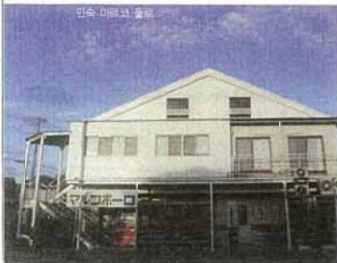
민숙 마르크 플로 民宿マルコポーロ