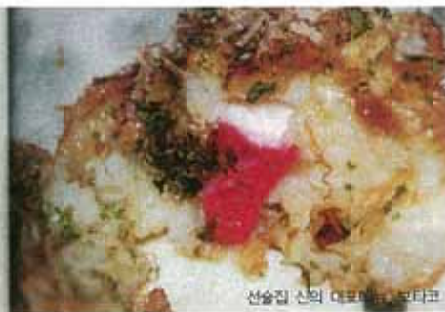
선술집 신의 대표 메뉴 보타코

· 이에섬산 소고기 합박 정식(ハンバーグ定食) · 한바구 타이쇼쿠 / 쿠키(或 홍차 포함) 1350엔 · 치킨 구이 정식(チキン南焼定食) · 치킨 난반 타이쇼쿠 / 쿠키(或 홍차 포함) 1000엔 · 새우 프라이 정식(エビフライ定食) · 에비 후라이 타이쇼쿠 / 밥, 된장국, 단무지 포함 1000엔 · 곶동어 소금구이(鰯焼) · 사바 시오아키 / 밥, 된장국, 단무지 포함 700엔 · 일거로 만든 빵과 아체 볶음(フーチャブル 후천부루) / 밥, 된장국, 단무지 포함 650엔 · 어린이 런치(お子様ランチ) · 오코시마 런치 / 칼피스 주스(或 얼음빙수) 연례 700엔