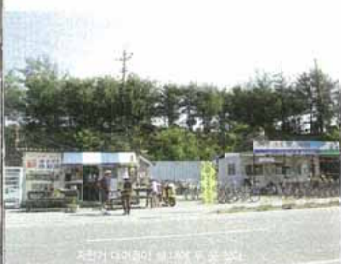
자전거 대여점이 있는 아에항 주차장

① 렌탈이 정해진 바에 따라 렌탈 가능 차량에 있는 31세 전 19세 후 일만 가능한 등차, 차량의 사용은 필수. ② 일본 면허 12년은 이의 대여는 불가하다.