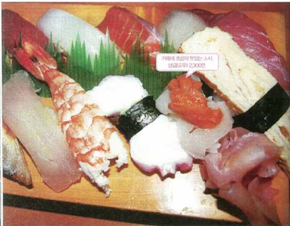
카에데 초밥의 5인용 스시 상금(포우) 2,000엔